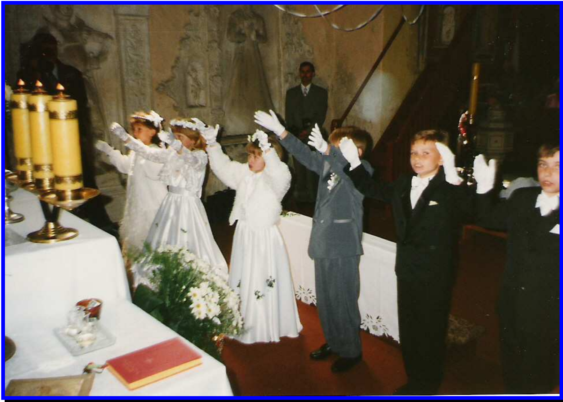
I Komunia Św. w Czernicy