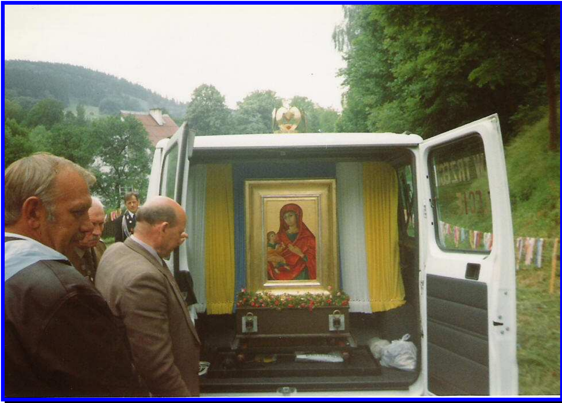
Powitanie Obrazu M.B. Łaskawej w Chrośnicy